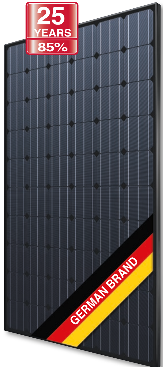
Abb. ähnlich 60M156DE180326A